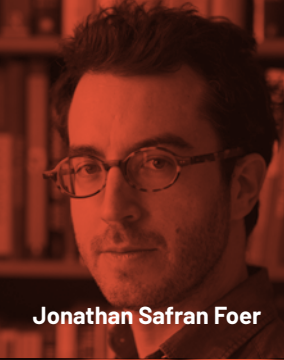
Jonathan Safran Foer