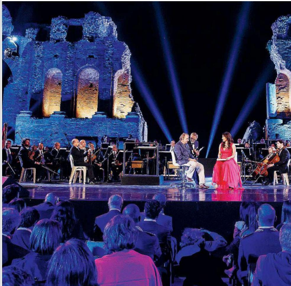
Taobuk. Lo scrittore Michel Houellebecq nell'edizione dello scorso anno