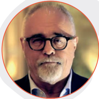
Mario Bolognari Sindaco di Taormina

La presentazione della XII edizione del Taormina Book Festival è per me motivo di particolare emozione. Infatti, dopo due anni trascorsi con la terribile crisi pandemica questo appuntamento significa la consacrazione della ripresa e la certezza che la rinascita della Città di Taormina è dinanzi a noi. Potrei dire resurrezione, visto che dal punto di vista economico e sociale la crisi sanitaria che abbiamo attraversato è paragonabile alla morte.