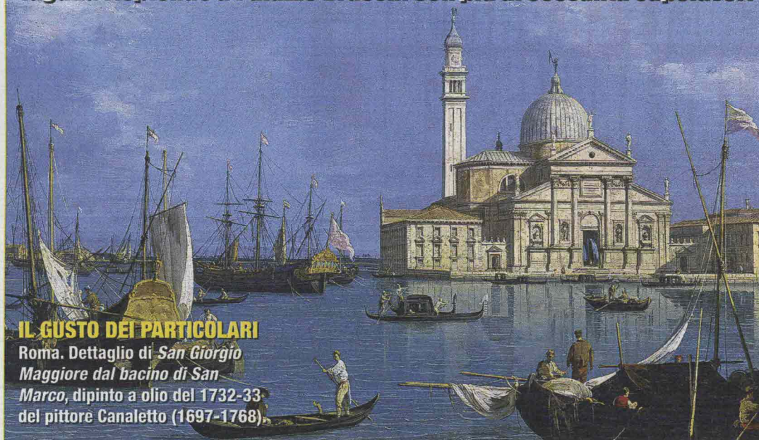
IL GUSTO DEI PARTICOLARI Roma. Dettaglio di San Giorgio Maggiore dal bacino di San Marco , dipinto a olio del 1732-33 del pittore Canaletto (1697-1768).

Il talento dell'artista che ha reso celebri le vedute dettagliate della laguna risplende a Palazzo Braschi con più di sessanta capolavori